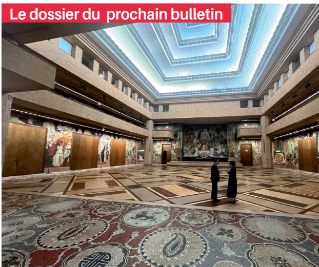
Le dossier du prochain bulletin