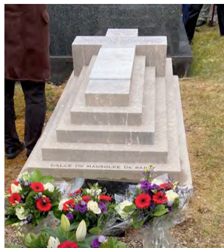
Ci-dessus : cérémonie au château de Thorey-Lyautey avec 3 classes de l’école Marie-Marvingt. Photo de droite : la tombe de la maréchale après restauration.

de la Fondation Lyautey et des habitants de la commune étaient présents. La cérémonie s’est terminée par une collation organisée par la municipalité de Thorey-Lyautey et ses nombreux bénévoles. Le petit village de Thorey-Lyautey pouvait s’enorgueillir de cet hommage solennel, rendu à la Grande Dame qui l’avait habité au siècle dernier.