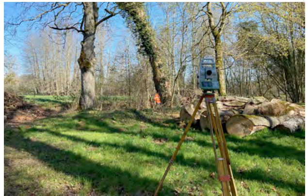
Abattages et élagages des arbres dangereux dans le parc.

Comme prévu lors de notre dernière Assemblée Générale, le site est en cours de refonte et sera opérationnel avant l'été. Il a pour vocation d'être le site de référence pour l'ensemble des personnes qui s'intéressent au Maréchal Lyautey, les donateurs potentiels de la Fondation, les soutiens institutionnels, les professionnels et adhérents. Les étudiants ou chercheurs y trouveront également des archives plus «poussées», notamment les documents relatifs aux activités de la Fondation au cours des deux dernières années. Les actualités de la Fondation et les renseignements pratiques seront mis à jour régulièrement.